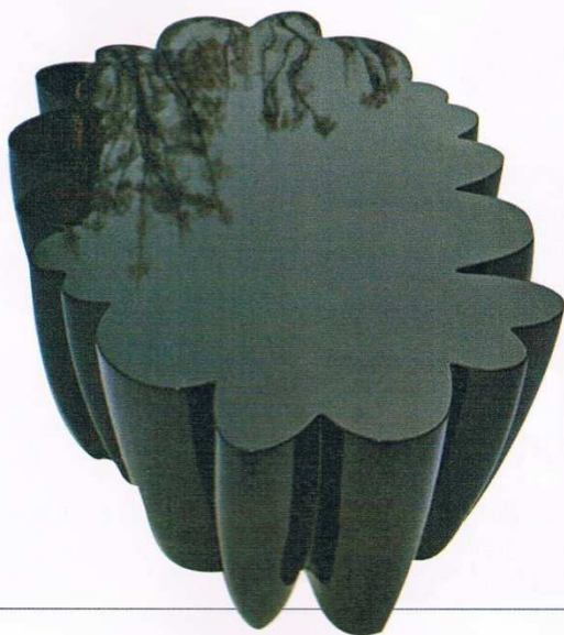
Pagina accanto, veduta della galleria Bensimon di Parigi durante la mostra "Upcycling: Etat (S) de la matière" del collettivo Wiithaa, svoltasi dal 29 maggio al 9 giugno 2013.